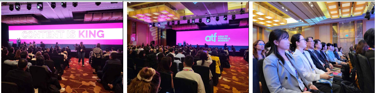
2025년 ATF 연계 방송콘텐츠 해외유통 행사사진